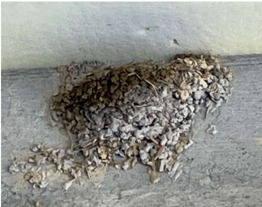
▲左上が補修した部分