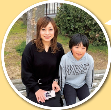
明石市貴崎在住 Nさん

10年ほど前に家族4人で姫路から明石へ引っ越してきました。最初は、慣れない土地で地域の行事など何をしているか分からず、不安でした。自治会に入って、顔見知りも増え、横のつながりができたことで安心して暮らしています。