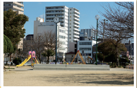
きれいになった材木町公園

当町内会にある材木町公園は長年手入れがされず、樹木や草は伸び放題で、みんなが憩える場所ではありませんでした。平成29年頃に地域の方から「なんとかきれいにできないだろうか」という声があり、当町内会と近隣自治会で話し合い、市へ申し入れをしました。その結果、樹木が剪定され休憩施設が改修されるなど、見違えるほどきれいになりました。そして、きれいになったこの姿を維持していくため、休止中であった公園愛護会が活動を再開し、清掃活動や花壇の手入れを行っています。