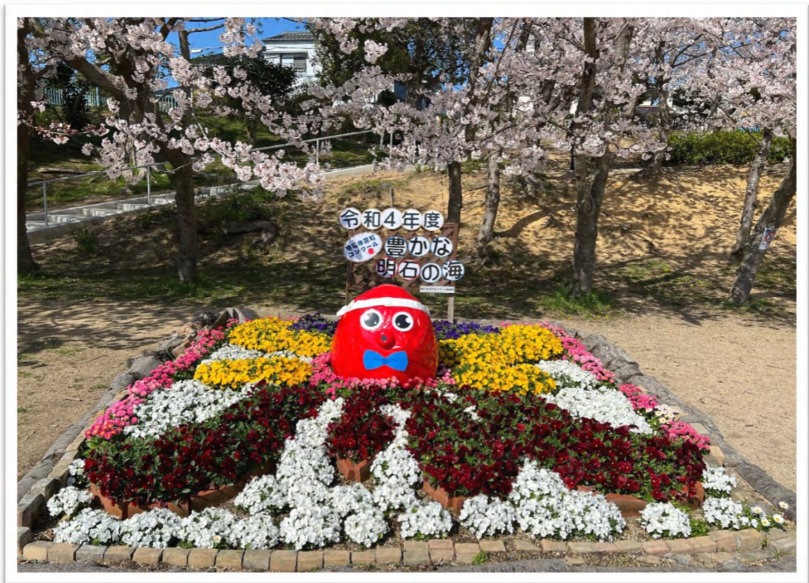
錦が丘中央公園 令和4年4月4日撮影