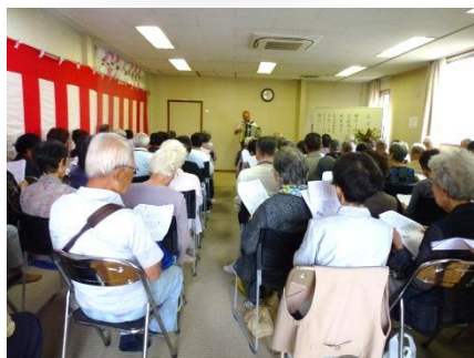
アコーディオンの伴奏で合唱を 楽しむ貴崎自治会の敬老会