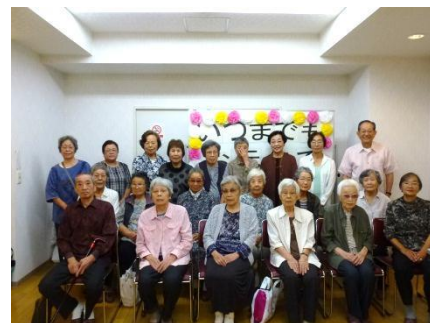
参加者全員で記念写真を撮った サンラフレ明石自治会の敬老会