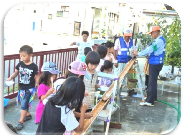
後ろの子にも回るよう‘そうめん’を見送るやさしい貴崎つ子たち

9月11日(金)の放課後、むりょう塾による恒例の「そうめん流し」が、貴崎みんなのひろば‘よっといで’で開催されました。「そうめん流し」を楽しみに集まってくる子ども達のため、むりょう塾のボランティアさんたちは朝から、そうめんを流す竹を洗って組み立てたり、そうめんを茹でたり、「つゆ」を作ったりと準備に大忙し。放課後、友達と連れ立って三々