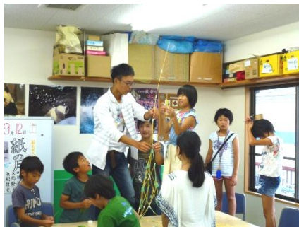
周りを見て、もう少し高くしようとチャレンジしましたが・・・？