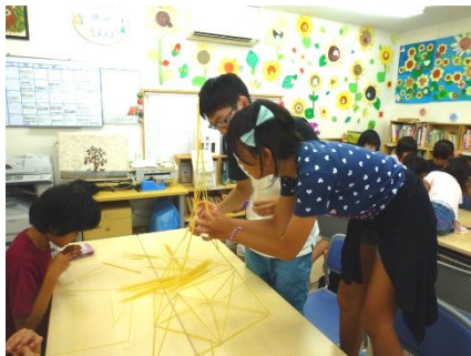
パスタブリッジは、しっかりした土台作りが肝心

また昼からは夏休み恒例の「宿題しようか」で明石高専の学生といっしょにパスタブリッジに挑戦。パスタブリッジはパスタを接着剤等を用いて組み上げた橋のことで、建築分野ではよく構造力学の研究に利用されています。今回は橋ではなくタワー作りで高さを競い合いました。