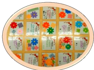
子ども達が作った 手作りのコースター

貴崎校区の敬老会が9月21日(月・祝)に消防会館ほか3会場で開催されました。今年も各自治会ごとに限りある予算の中で、それぞれ工夫を凝らして、記念品を配ったり、ぜんざいを振舞ったり、手品やアコーディオンの伴奏で合唱したりまたビンゴゲームを楽しんだり、益々の長寿を願い心のこもったおもてなしをされました。また、貴崎子ども会の子供たちが作った手作りコースターがプレゼントされました。