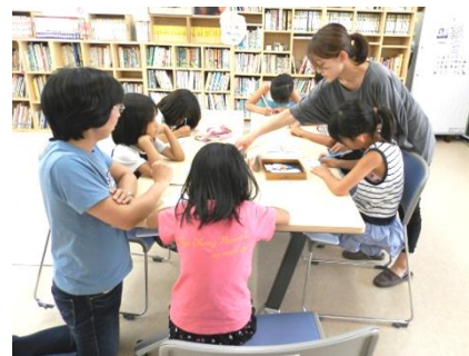
敬老の日のプレゼント作りに 集まった子ども達