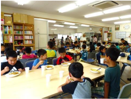
よっといで菜園で採れた野菜でカレーを子ども達に振舞いました

長かった夏休みも残りわずかとなった8月28日(金)、開設10周年を迎えたむりょう塾では、貴崎みんなのひろば‘よっといで’でカレーパーティと夏休み恒例の「宿題しようか」を同日開催しました。カレーパーティは初夏に‘よっといで野菜園’で収穫したジャガイモでむりょう塾のボランティアの皆さんが腕をふるっての貴崎の母の味。訪れた80人がおいしいおいしいとご満悦の表情で帰りました。