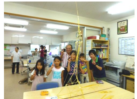
土台も支柱もしっかり設計皆で楽しく、優勝のVサイン