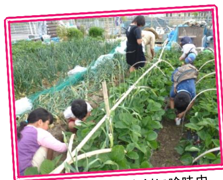
赤くて大きいの…真剣に吟味中