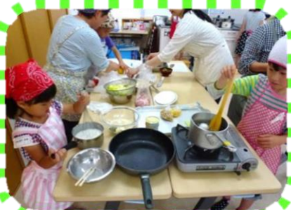
デザートとサラダ作りに挑戦♪