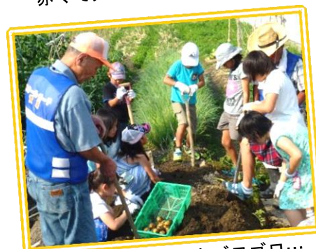
土の中からじゃがいもゴロゴロ…