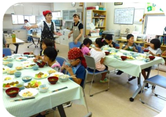
美味しい食事に会話も楽しく弾みます

6月20日（土）貴崎みんなのひろば“よっといで”で「わくわく元気っ子・子ども料理教室」が開催されました。明石市健康推進課の栄養士の指導のもと、16人の貴崎っ子たち（男の子6人、女の子10人）が3班に分かれ、地域ボランティアの方々の助けも得ながら、ワカメご飯・鶏肉の香りパン粉焼き・大豆のサラダ・ホタテのスープ・牛乳わらびもち作りに挑戦。栄養バランスや食事の大切さについて説明を受けた後、調理道具の扱い方、衛生的に調理を進めるにあたっての注意を聞いてクッキング・スタート。それぞれが役割分担してメニューを無事完成させた後はワイワイと楽しいランチタイムを過ごしました。