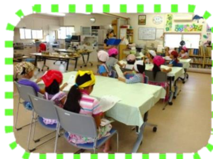
説明を熱心に聞いています