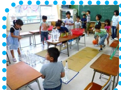
ボールでペットボトルを倒せ！