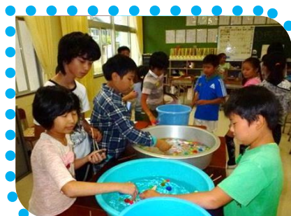
二人で協力、スーパーボールすくい