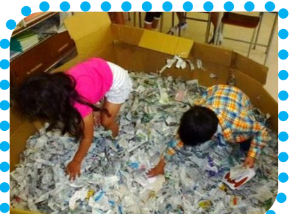
おさるを見つけてポイントゲット！