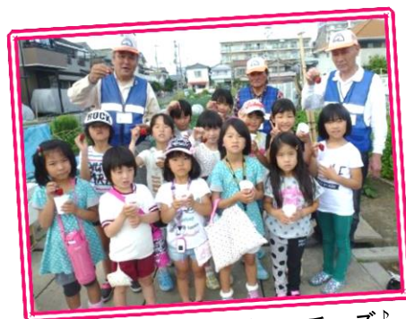
収穫したイチゴを手に、チーズ♪