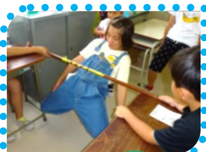
限界に挑戦？ リンボーダンス