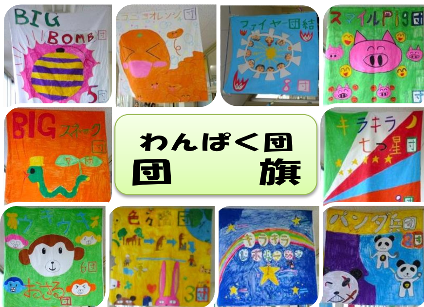
色とりどりのオリジナル団旗は貴崎っ子達お手製 運動会でも活躍！

6月4日(金) 貴崎小学校で恒例の「貴崎っ子まつり」が開催されました。全校児童が6年生～1年生でチームをつくる「わんぱく団」(「ニコニコオレンジ団」や「ファイヤー一団結団」など10団)に分かれて6年生のリーダーを中心に趣向を凝らし、楽しい遊びの世界を創り上げました。当日は多くの保護者や地域の方々が来られ貴崎っ子たちとふれあい、楽しいひと時を過ごしました。また貴崎幼稚園の園児たちも訪れて小学校のお兄さん、お姉さんから優しく接してもらいながら貴崎っ子まつりを楽しみました。コミセンの教養室では高年クラブが「折り紙教室」を開催。日頃鍛えた(?)折り紙の腕前を生かして、訪れた多くの貴崎っ子達に優しく折り方を指導。折り紙を通して高齢者の皆さんと貴崎っ子達の楽しい交流の時間が流れました。