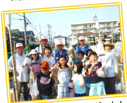
見て見て～じゃがいもゲット！