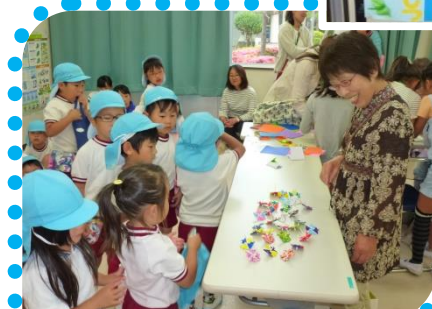
高年クラブによる「折り紙教室」