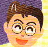
自営業男性 Cさん事務所

(注)お仕事の内容や時期によっては、お時間をいただく場合も ありますのでご了承ください。高所作業や危険、有害な仕事 などはお断りする場合もございますのでご了承ください。