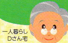
一人暮らし Dさん宅