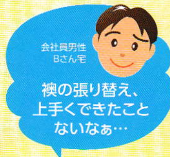
会社員男性 Bさん宅