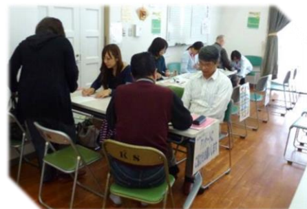
アンケートへのご協力 ありがとうございました