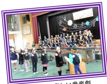
1年生の楽しい音楽劇