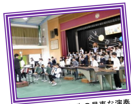
トリを務めた6年生の見事な演奏