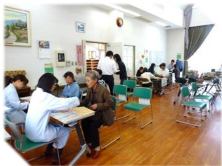
問診票記入事項聞き取りの様子

今年で4回目となる貴崎校区健診が10月31日(土)貴崎集会所で実施されました。この検診は地域全体で健康づくりに取り組むべく、明石市が貴崎校区まちづくり協議会と貴崎小コミセンの共催で実施しています。当日は54人の住民のみなさんが指定時間帯に順序良く訪れ受診されました。また「健診結果はこう見る！こう使う！」と題して12月11日には受診者を対象に健診結果説明会も催されます。がんや生活習慣病は早期発見・早期治療が基本です。健康寿命を伸ばして笑顔で明るい生活をおくりたいものです。