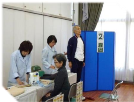
血圧測定・身長・体重・腹囲測定