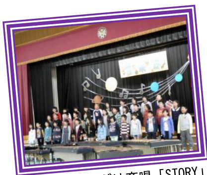
オープニングは斉唱「STORY」

貴崎小学校2学期の2大イベントの一つ「音楽会」が11月7日(土)貴崎小学校体育館で開催されました。夏休み、懸命に練習した鍵盤ハーモニカと合唱で音楽劇「友達になろうよ」を演じた1年生、初めての合奏にチャレンジした2年生、リコーダー奏による「ドレミの歌」を披露した3年生、合奏・合唱と共に迫力ある群読で会場を魅了した4年生、「絆」と「挑戦」をテーマに合唱「心の瞳」・合奏「威風堂々第1番」を披露した5年生、小学校締めくくりの音楽会にふさわしい「翼を広げて」・「輝くために」の2曲の合唱と壮大な「組曲『惑星』より木星」を演奏した6年生。貴崎っ子たちは先生方の指導のもとクラスや学年の友だちと共に本番に向けて毎日早朝・放課後・業間に練習を積み重ねてきた成果を見事に発揮。会場で鑑賞した保護者や来賓の皆さんは大きな感動と共に惜しめない拍手を送り続けました。