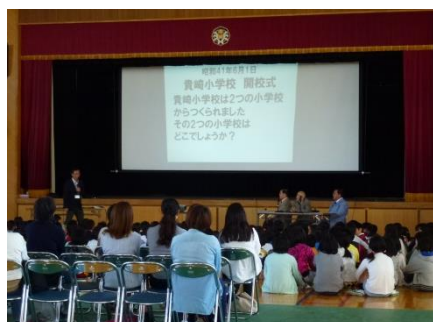
貴崎小学校は花園小学校と 林小学校から作られました