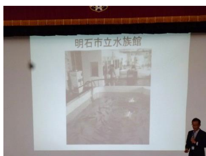
水族館では蛸つりが人気で、 持ち帰ることもできました