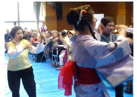
炭坑節の振り付けで「きよしのズンドコ節」を一緒に踊る参加者達