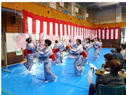
朝霧音頭普及振興会の皆さんがユーモラスに踊ります