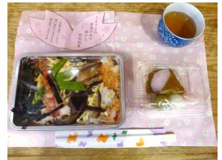
りんどうの会の皆さんが丹精込めた「ちらし寿司は」いつも大好評