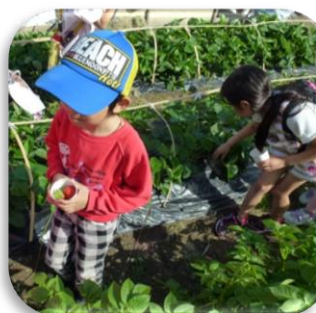
熟したイチゴはどこだ

毎週金曜日の貴崎みんなのひろば‘よっといで’で活動しているむりょう塾に集まる子ども達が5月13日(金)の放課後、貴崎5丁目にある‘よっといで野菜園’