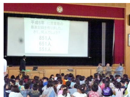
昭和42年の開校当時の児童 数は483人でした