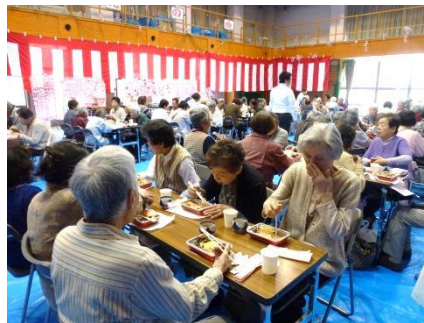
皆と一緒に食べる食事は本当に美味しい 話も弾みます