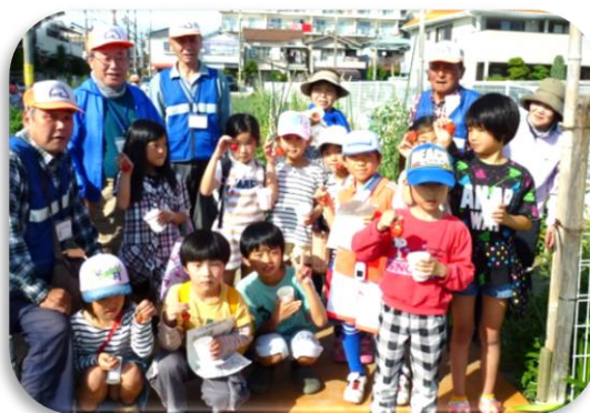
収穫したイチゴを手に笑顔の子ども達

でイチゴ狩りを楽しみました。よっといで野菜園のボランティアの皆さんは、子ども達にいろんな収穫体験を楽しんでもらおうと額に汗して野菜の世話をしています。6月は‘じゃがいも掘り’が楽しみです。