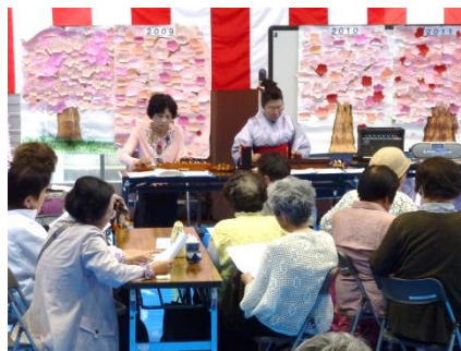
大正琴の伴奏で、みんなで「ひな祭り」や「黒田節」を斉唱