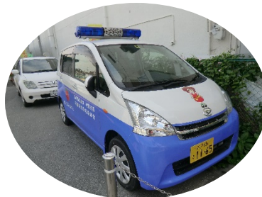
青パト 花ちゃん号