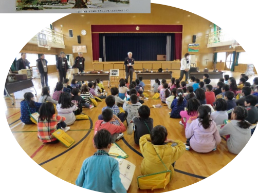
北条まちづくり協議会の方から説明を受けました。