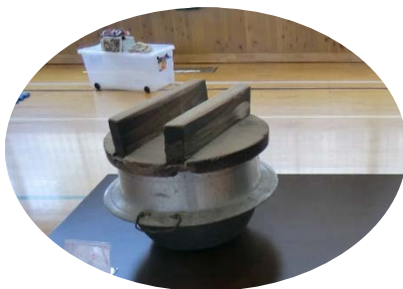
ごはんを炊くのに使っていた羽釜 は かま

2月24日(水)花園小学校体育館において、加西市のNPO法人まちづくり北条の皆さんが、昔の生活道具約50点余りを持ち込み、移り変わる道具に触れ、形の変化と生活、道具の工夫を学ぶ五感を使った学習をしました。