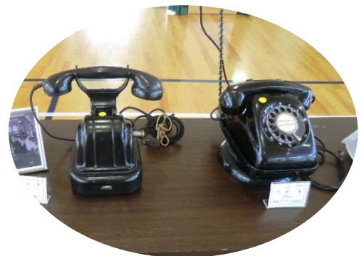
昔なつかし電話です。