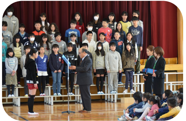
児童代表へ表彰状を渡しました。